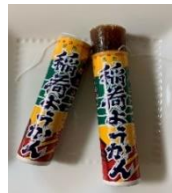
↑ 祐徳稲荷神社 ← 稲荷ようかん

参道名物のお土産は「稲荷ようかん」 見た目は花火の様ですが、下から押し出して糸で切って食べます。